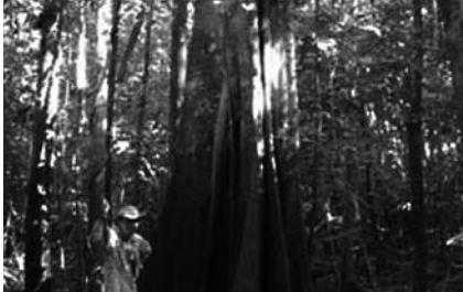
Global denken - lokal handeln!

Seit acht Jahren leite ich ein Regenwaldschutzprojekt in Brasilien. Ziel der Floresta da Vida ist es, Natur zu schützen und den Einwohnern ein Auskommen zu geben. Mit der Hailife-Kampagne haben wir bewiesen, dass durch strukturiertes Verhandeln der deutsche Markt so gut wie halbfleischfrei zu bekommen war – ohne die Unternehmen erst öffentlich an die Wand zu nageln. Und Dank der SPD – Umweltpolitik haben wir weitgehend konsensual den ersten umfassenden Luftreinhalteplan der Republik verabschiedet – noch immer warten wir auf die notwendigen Maßnahmen der Bayerischen Staatsregierung, die Umweltzone umzusetzen. Erst wenn alle Akteure im Markt – Bürger, Staat und Wirtschaft - verstanden haben, dass Umweltpolitik die Schlüsselfrage der Zukunft ist, hat Umweltpolitik ihr Ziel erreicht: sich selbst überflüssig zu machen, da Ökobilanzen, Nachhaltigkeitsmanagement und Empathie für die Wunder der Schöpfung Notenschlüssel menschlichen Handelns sind.